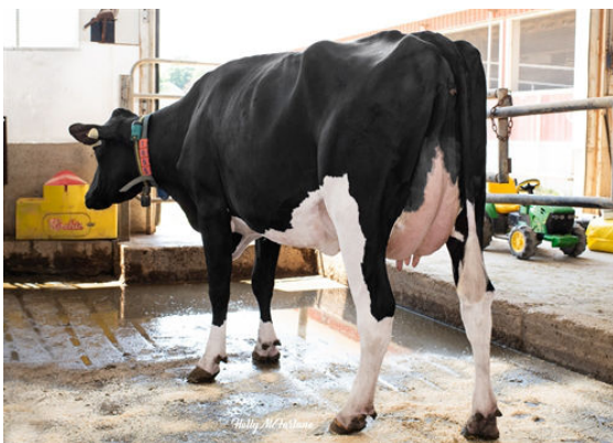
PROGENESIS CHARLEY TULIP FIFTH DAM