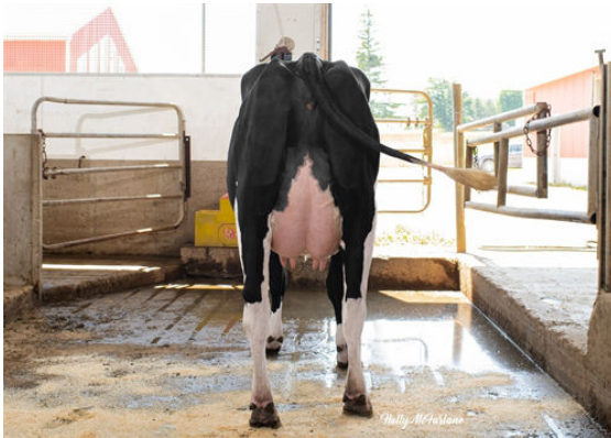
PROGENESIS CHARLEY TULIP FIFTH DAM