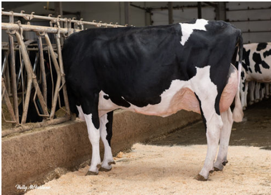
PROGENESIS POSITIVE TRILLIUM FOURTH DAM